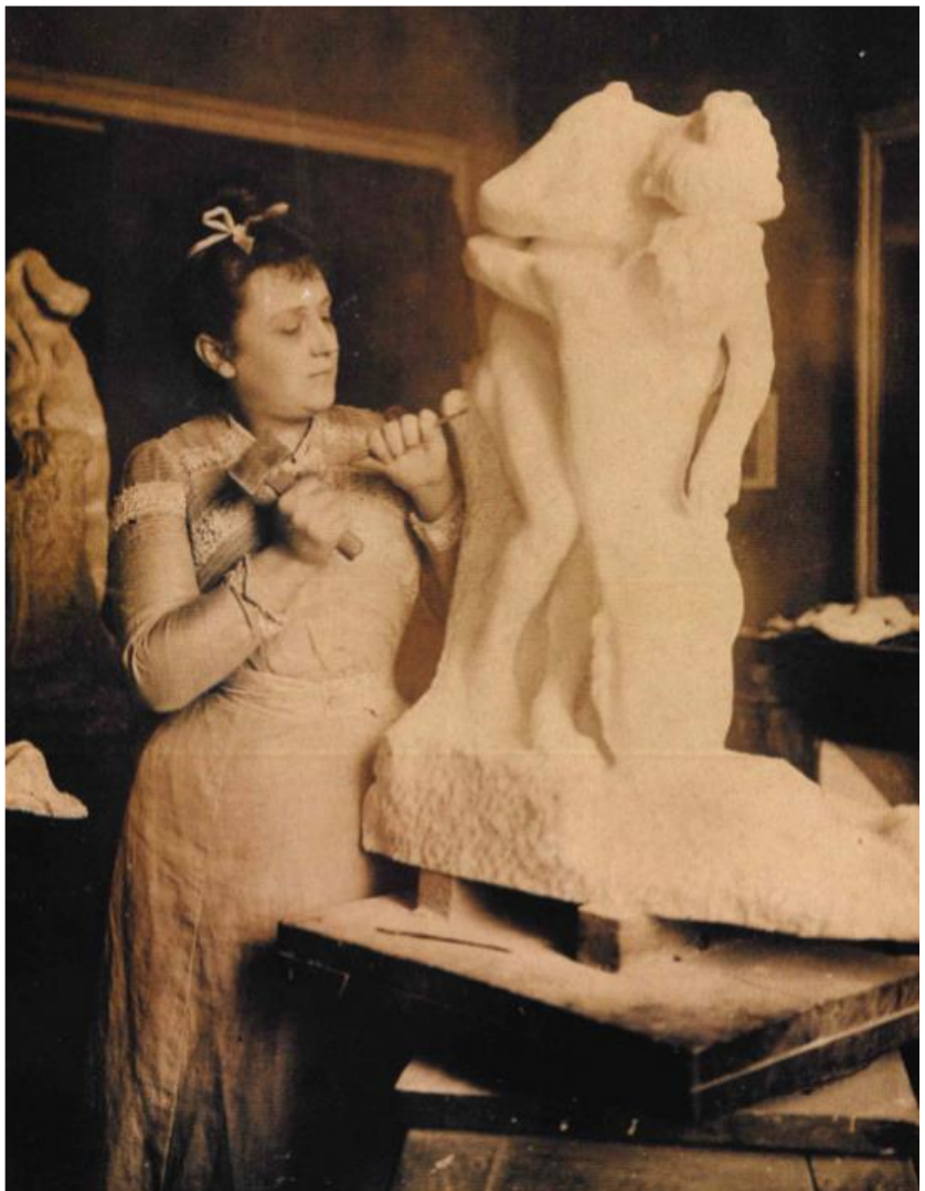
Camille Claudel sculptant Vertumne et Pomone

En pleine maîtrise de son art, Camille Claudel voit cependant sa créativité tarie par des délires de persécution. Elle se barricade, détruit ses œuvres et finit par être internée à la demande de sa famille, et ce jusqu'à la fin de sa vie en 1943.