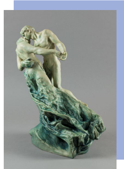
Camille Claudel, La Valse, 1889-1893