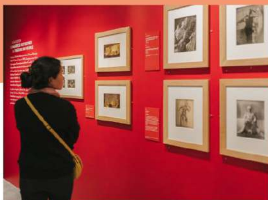
Vues de l'exposition « Camille Claudel à l'œuvre : Sakountala »