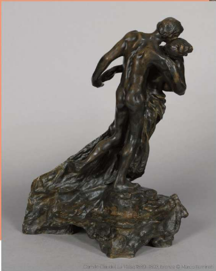
Camille Claudel, La Valse, 1889-1893, bronze